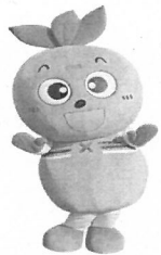
マスコットキャラクター「笹太郎」