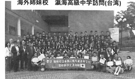
海外姉妹校 瀛海高級中学訪問(台湾)